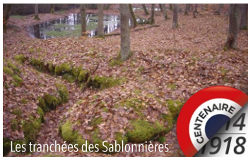
Les tranchées des Sablonnières

(une 2 e visite pourra être proposée à 16h en fonction du nombre de participants).