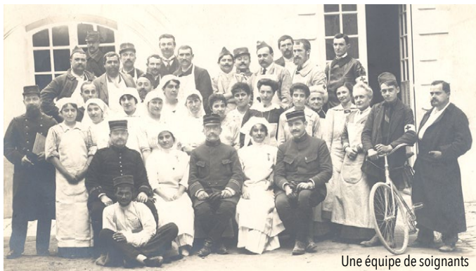
Une équipe de soignants

Infos pratiques : entrée libre dans la limite des places disponibles