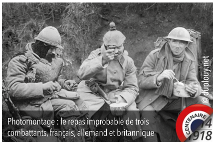
Photomontage : le repas improbable de trois combattants, français, allemand et britannique

Infos pratiques : exposition visible aux horaires d'ouverture de la bibliothèque et pendant les journées européennes du patrimoine